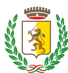
Comune di Pandino Cremona